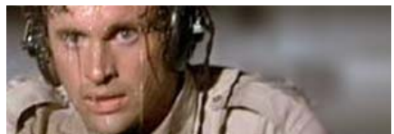
Elegi un mal día para dejar de fumar