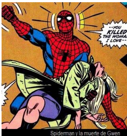
Spiderman y la muerte de Gwen