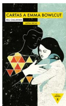
Cartas a Emma Bowlcut

Cartas a Emma Bowlcut es una de las principales novedades de la próxima temporada de la editorial Alpha Decay, el debut literario del músico Bill Callahan.