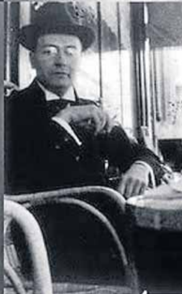
Pocas imágenes se conservan del ensayista alemán Walter Serner.

tas un escándalo literario mayúsculo. Después de romper con los dadaístas en 1918, Serner abandonó Suiza y se entregó a una inestable vida de viaje por Europa, publicando regularmente narraciones eróticas y cuentos criminales, obras de teatro, artículos, poemas descabellados y un par de novelas.