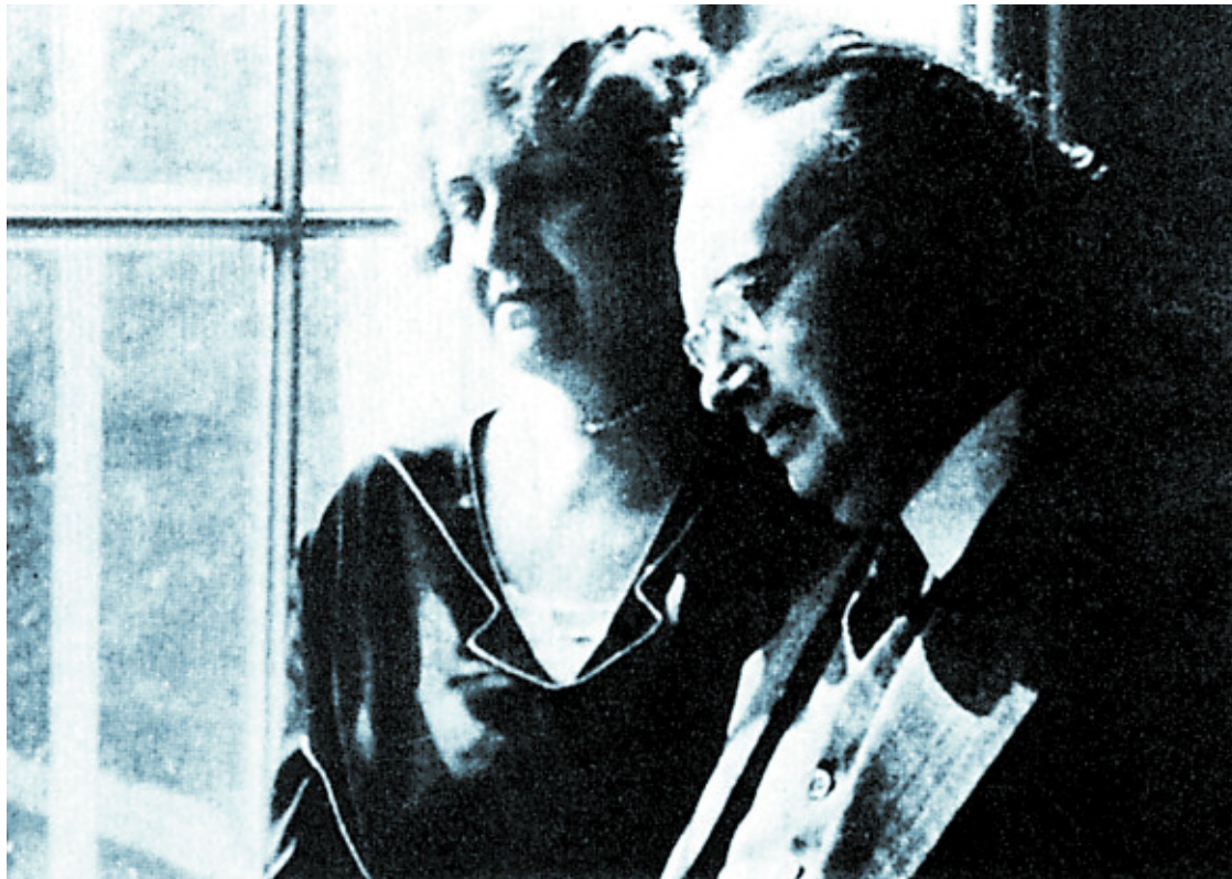
Alma Mahler y Franz Werfel, en su casa de California.

Reunión de bachilleres es de 1928, pero su primera novela data de 1924. Sus obras de los años veinte tienen un inequívoco aire expresionista que aquí, además, se centra en un instituto público, una historia de adolescentes revivida desde la perspectiva de la edad madura. Werfel no es un gran escritor, pero la creación del clima opresivo de primeros de siglo en un centro escolar mientras en segundo término, casi sombras, aparecen esas familias rígidas, esa burguesía funcional o comerciante de la época de preguerra que rodea, protege, exige y aplasta a la vez a sus vástagos, está conseguida de manera muy convincente. Es una época de decadencia y, a la vez, prerrevolucionaria, y en ella