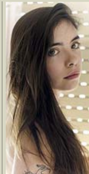
La editora y poeta.

Internet. Muchos comenzaron sus andanzas en la literatura desde la blogosfera y prácticamente todos han utilizado este medio para relacionarse e informarse. Sobre su estilo, algunos críticos han dicho que en esta generación hay una vuelta al Yo muy fuer-