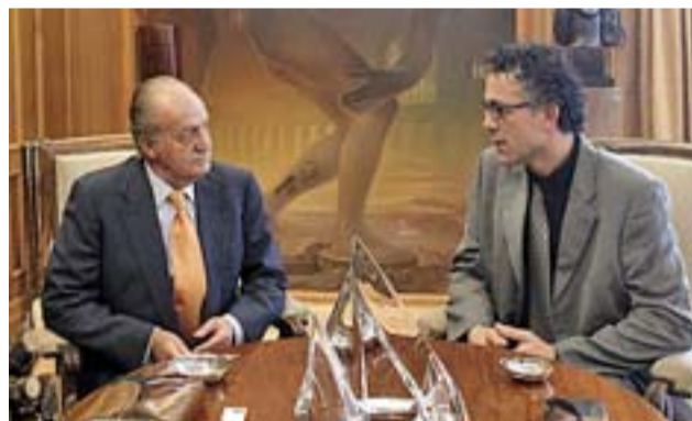
El Rey y el diputado de Amaiur Mikel Errekondo, ayer.

Antes de la reunión de la Mesa del Congreso, el rey Juan Carlos recibió al portavoz de Amaiur, Mikel Errekondo, en Zarzuela dentro de la ronda preceptiva del monarca con todos los grupos con representación parlamentaria previa a la