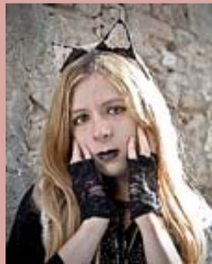
La autora siciliana.

Surrealismo hiperrealístico. Es muy realista, sí, y parece muy autobiográfico... Por suerte sólo hay un 0,1% de mí en él. No me atrae escribir de cosas familiares.