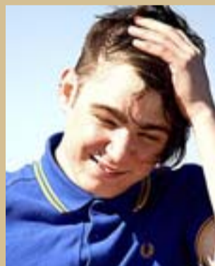
El escritor británico.

No creo, pero pienso que tienes que salir de tu casa para vivir, porque puede ser demasiado fácil quedarte en en sofá leyendo todo el día.