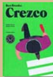
'Crezco' BEN BROOKS Blackie Books