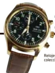
Relojes de la colección 2012 de IWC

«Habla ya antes de que sea demasiado tarde, y confía luego en seguir hablando hasta que no haya nada más que decir. Después de todo se acaba el tiempo». Paul Auster en 'Diario de invierno'