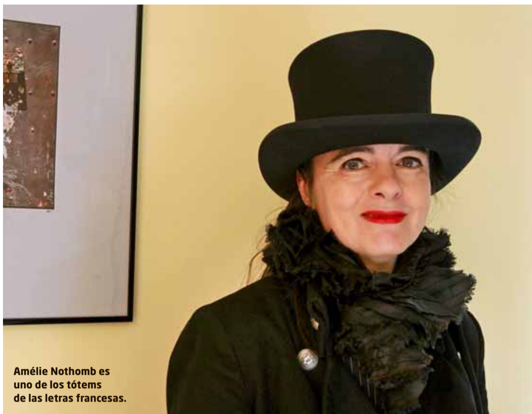
Amélie Nothomb es uno de los tótems de las letras francesas.

Perfetsky, poeta, provocador profesional y héroe de la resistencia ucraniana, ha desaparecido en las frías aguas del Gran Canal de Venecia. Llevaba su dictáfono consigo y lo que se sabe de él es lo que dicen quienes le vieron asistir al delirante congreso titulado El absurdo postcarnavalesco del mundo . Sátira con aspecto de collage de vértigo del maestro Andrujovich.