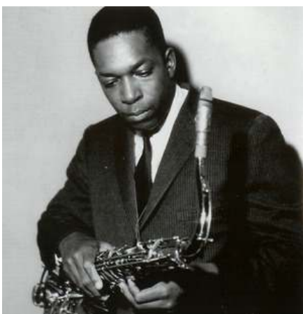
John Coltrane