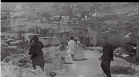
'EL PRISIONERO DEL CIELO' (Planeta), de Carlos Ruiz Zafón, con una cuidada realización que se basa en la animación de fotos de época. Las miradas sobre Barcelona de Pérez de Rozas, Català-Roca y diversos autores anónimos, aderezadas con buenas dosis de postproducción, sirven para reconstruir el universo zafoniano.