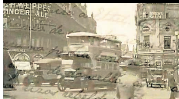
'LA CAÍDA DE LOS GIGANTES' (Plaza & Janés), de Ken Follet, es otro ejemplo de producción muy cuidada y lenguaje y estética muy documental. Imágenes de archivo que encadenan una tras otra al ritmo de una profunda y evocadora voz en off y una música que busca la emoción sin atajos.