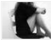
La joven Dolores, un disco para mudarse de piel