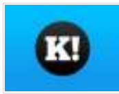
Memoria de los tiempos oscuros