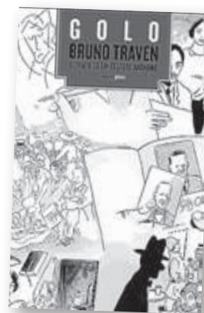
'Retrato de un célebre anónimo'

Autor: Jim Dodge Traducción: Alicia Frieyro Editorial: Capitán Swing Madrid, 2012 Páginas: 168