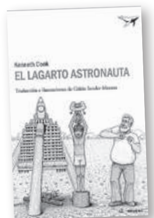
'El lagarto astronauta'

Autor: David Whitehouse Traducción: Rubén Martín Giráldez Editorial: Libros del Silencio Barcelona, 2012 Páginas: 328