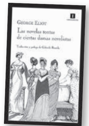
'Las novelas tontas de ciertas damas...'

Autor: Golo Traducción: Raquel Sevilla Editorial: Sexto Piso Barcelona, 2012 Páginas: 144