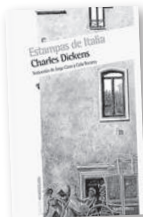
'Estampas de Italia'

Autor: George Eliot Traducción: Gabriela Bustelo Editorial: Impedimenta Madrid, 2012 Páginas: 62