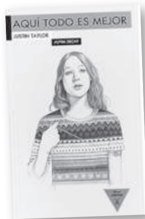
'Aquí todo es mejor'

“ La verdadera universidad de hoy en día es una colección de libros ”