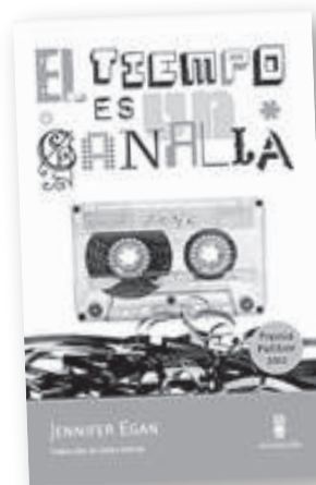
'El tiempo es un canalla'

Autor: Justin Taylor Traducción: Marta Alcaraz Editorial: Alpha Decay Barcelona, 2012 Páginas: 208