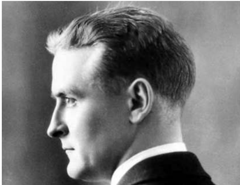
Francis Scott Fitzgerald (Saint Paul, Minnesota, 1896 - Hollywood, 1940).

Así que cabe preguntarse de qué modo el preadolescente, o el adolescente ya consumado, o el tránsito del uno al otro, constituyen un lugar común en el santoral americano. Para arrojar un poco de luz, la editorial Rey Lear rescata en su catálogo un texto no precisamente popular y considerado menor dentro de la producción de Francis Scott Fitzgerald (Saint Paul, Minnesota, 1896-Hollywood, 1940), La adolescencia de Basil Duke Lee , adscrito a la tradición antes referida pero poseedor de claves notoriamente singulares. Scott Fitzgerald es uno de los autores del canon estadounidense más celebrados de la actualidad, no sólo por haberse convertido en recurrente para el Hollywood al que entregó sus últimas dosis de inspiración (el sello Reino de Cordelia,