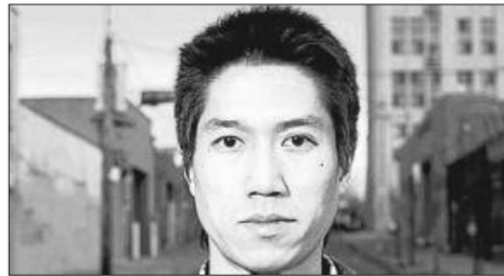
El escritor Tao Lin.

El término freegan hace referencia a un estilo de vida contrario al consumismo y consistente en el empleo de estrategias de índole vital basadas en la participación e implicación social y en una economía del mínimo consumo. Por ello, los freegans rescatan comida, desechada por los supermercados, de los contenedores por razones éticas más que por necesidad. Intuyo, dado mi desconocimiento sobre este asunto, que buena parte del colectivo que sustenta ese estilo de existir o movimiento alternativo vivirá conforme a un esqueleto de preceptos dirigido a una vida menos acelerada y frívola, quizá más plena; una sociedad que deshace lo transitado para