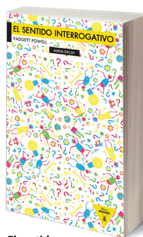
El sentido interrogativo Padgett Powell Alpha Decay 17 €

El autor ha obrado el milagro: hacer creer a sus lectores que el libro que están leyendo es literatura y no filosofía. Al final, el lector (y al autor) no puede más que preguntarse a qué viene todo esto: "¿Te queda claro por qué te hago todas estas preguntas? En general, ¿dirías que te ha quedado claro, muy poco claro, o más bien te encuentras en algún punto intermedio: en el tenebroso mar de las conjeturas? ¿Debería haber dicho «tenebroso mar de las conjeturas mentales»? ¿Tendría que largarme? ¿Dejarte en paz? ¿Es bueno que incordie a los demás con mi sentido interrogativo o mejor me lo quedo para mí?". Yo, por mi parte, no consigo desembarazarme de esta pregunta que desde ayer me persigue: "¿Qué es lo que hace que la literatura sea literatura y la filosofía filosofía?". ♦ Gabriel Arnaiz