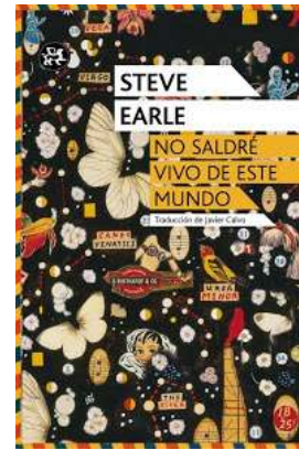
NO SALDRÉ VIVO DE ESTE MUNDO- STEVE EARLE