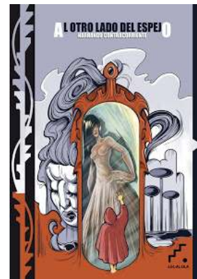
LIBROS EN LOS QUE PARTICIPO