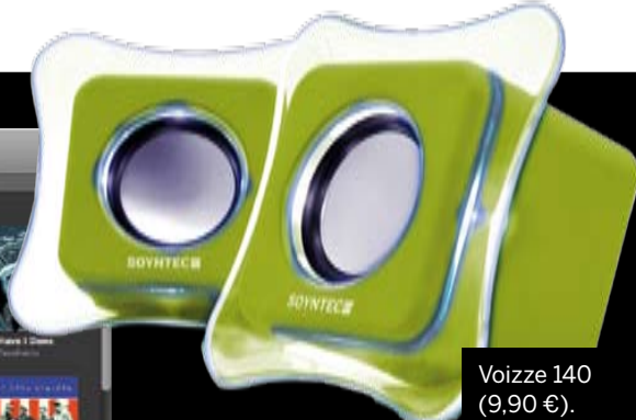
Voizze 140 (9,90 €).