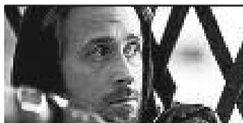
Blue Valentine DEREK CIANFRANCE

La película cuenta la historia del apasionado amor que viven Dean y Cindy, y que llevan a escena los actores Ryan Gosling y Michelle Williams.