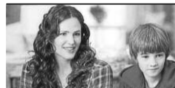
La extraña vida de Timothy... PETER HEDGES

La película cuenta la historia del apasionado amor que viven Dean y Cindy, y que llevan a escena los actores Ryan Gosling y Michelle Williams.