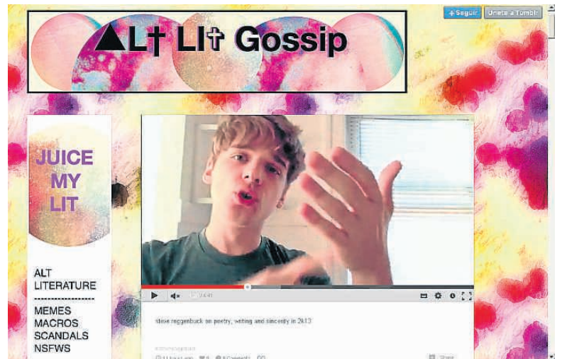
Tumblr Alt Lit Gossip