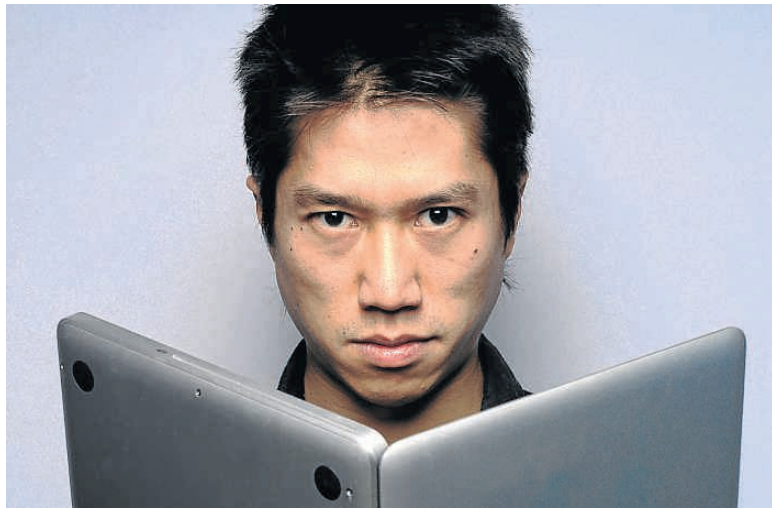
Tao Lin, importante exponente de la nueva narrativa norteamericana