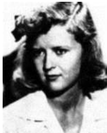
Una jovencísima Scottie