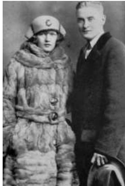
Zelda y F. Scott Fitzgerald

Decir, por si no lo he dicho en alguna otra ocasión, que la figura del matrimonio Scott Fitzgerald, Francis y Zelda, ha sido siempre muy atractiva para mí. Aparte de los escritos de él, la pareja llevó una vida apasionante, no exenta de problemas de todo tipo, en una época histórica y literaria absolutamente apasionante.