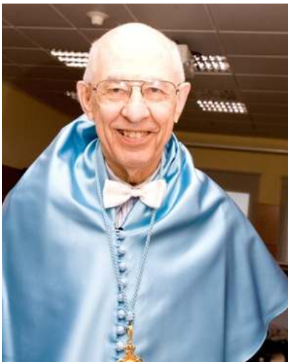
Hilary Putnam, autor de “Ética sin ontología”

El filósofo estadounidense plantea cómo abordar los conflictos morales actuales sin recurrir a presupuestos metafísicos