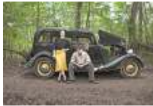
La miniserie de dos episodios fue un éxito en Estados Unidos. Se verá el 2 y el 4 de febrero.

Sublimación eterna para dos delinquentes en un contexto tan loco y violento como ellos, reformulación trágica de una historia de amor adrenalínica, o simplemente un hecho real que habilita una y otra vez una visita a dos "marcados". Así se había definido Bonnie en una declaración que no hace mucho editó Alpha Decay en Wanted Lovers: las cartas de amor de Bonnie & Clyde: "Así que ya lo ves, ¿no es cierto, querido? Me casaría contigo ahora mismo, si pudiera, y volvería contigo al campo, pero sé que no serviría de