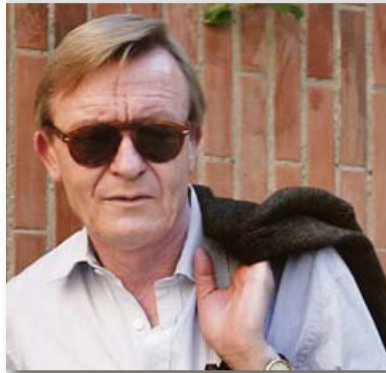
Jean Echenoz.

► Despertarse con el vacío de memoria propio de una fiesta excesiva y descubrir que estaba compartiendo cama con un cadáver fue para Victoire una sensación tan desconcertante que lo único