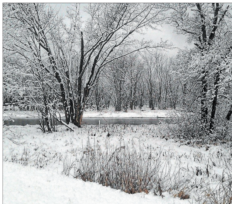
Paisaje rural de Wisconsin, donde crece la historia.

El frío, los bosques y la fauna de Wisconsin llegan al lector a través de unos ojos que, a pesar de estar acostumbrados a ellos, no se han desamorado del paisaje: la lírica que persigue cada hoja caída, el naranja de cada amanecer avistado, están a la altura emocional de todos los recuerdos que los protagonistas rememoran con tanta fuerza y melancolía. Recuerdos unidos a