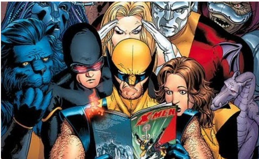
Cuerpos mutantes para futuros pasados