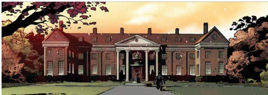
Instituto Xavier para Jóvenes Talentos

En el universo Marvel hay un colegio privado que esconde el reverso indeseado de los superhéroes. El Instituto Xavier para Jóvenes Talentos es una mansión ajardinada en las afueras de Nueva York, un centro de lujo y alto standing donde se refugian los mutantes, que es una variante muy concreta de suprahumano. La mayor parte de los personajes de la editorial originan sus cualidades en un accidente: una bomba para La Masa, una araña para Spiderman, un viaje espacial defectuoso para Los Cuatro Fantásticos . Los mutantes tienen el superpoder en su interior; adquieren sus cualidades por vía genética y afloran por sorpresa en la adolescencia, transformando sus cuerpos como la pubertad puso en su sitio los nuestros. Los mutantes son el nuevo paso evolutivo, que convierte al Homo Sapiens en obsoleto.