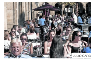
Turistas en las terrazas de la Plaça Reial de Barcelona, el 21 de mayo.