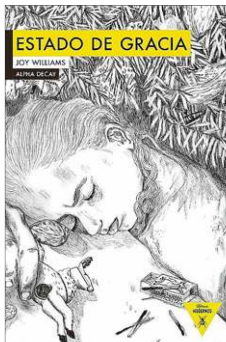
Joy Williams Estado de gracia ALPHA DECAY. Barcelona, 2016

Aunque siempre soy bastante crítica con los estudiantes y profesores de escritura creativa -que no atino a saber qué cosa es-, Estado de gracia fue un debut que no decepciona y que, además del mencionado galardón ha recibido los halagos de Raymond Carver y Don DeLillo, entre otros. En esta novela la protagonista absoluta es Kate, una universitaria embarazada que oculta un pasado turbio y tiene una visión peculiar sobre el embarazo. Nos encontramos en una época en que el