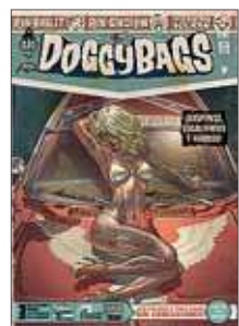
VVAA Doggy Bags 2 DIBBUKS, 2016

Cuando hablamos del primer número de Doggy Bags , dijimos que los autores resucitaban el espíritu de los cómics americanos previos a la censura, apelando a la libertad creativa, a la violencia y a la testosterona. Pues bien: este segundo volumen se reafirma en todos los sentidos. En esta ocasión tenemos cambio parcial de equipo creativo. La primera historia, 'Elwood and the 40 freak bitches', de Ozanam y Kieran, aporta al conjunto el elemento necesario de sangre y sexo. En ella, una especie de redneck texano se da cuenta de que el creciente interés de mujeres espectacularmente bellas por él no puede ser sino parte de una conspiración extraterrestre, que busca que las alienígenas copulen con terrestres para empezar su invasión secreta. Esta primera historia podría tener una primera lectura ciertamente machista o misógina,