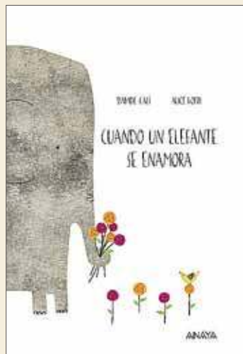
Davide Cali y Alice Lotti Quando un elefante se enamora ANAYA. Madrid, 2016

❖ El elefante de esta historia es muy gracioso. Está enamorado de una elefanta, pero es tan tímido que no sabe cómo decirselo. Sin embargo, hace todo lo que sabe hacer para llamar su atención. Se baña cada día, hace dieta, se viste elegantemente, coge flores, le escribe cartas... pero de nada sirven sus esfuerzos. ¿O tal vez algún día tendrán su recompensa? Para saberlo, tendréis que leer el cuento.