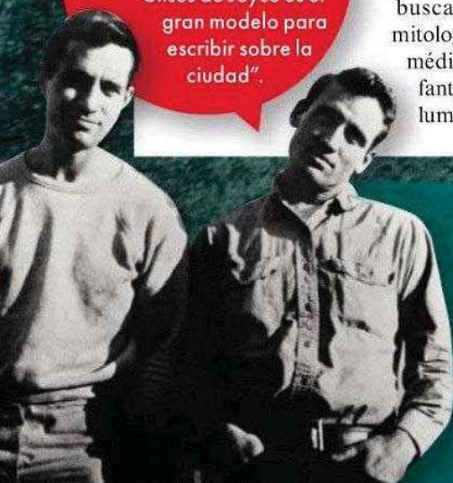
Neal Cassady y Jack Kerouac

“Caminar es una forma de conocer las cosas y sentir los ritmos del mundo. El Ulises de Joyce es el gran modelo para escribir sobre la ciudad”.