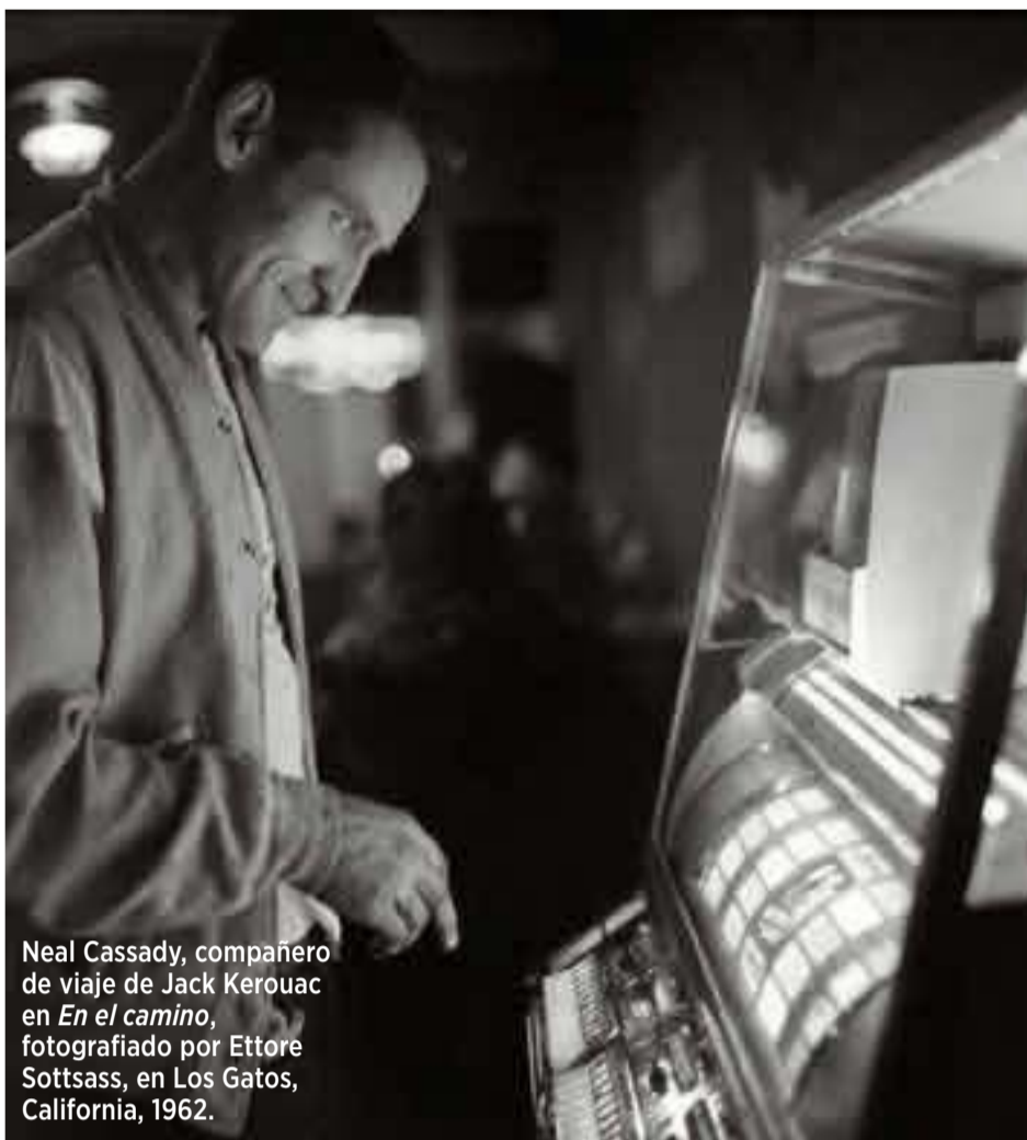
Neal Cassady, compañero de viaje de Jack Kerouac en En el camino , fotografiado por Ettore Sottsass, en Los Gatos, California, 1962.

'WALLPAPER' La revista traslada su pasión por la arquitectura y el diseño a esta colección, creada junto a la editorial Phaidon, en formato de bolsillo. Pese a que varios volúmenes se editaron en español, los últimos títulos solo se encuentran en inglés. www.phaidon.com