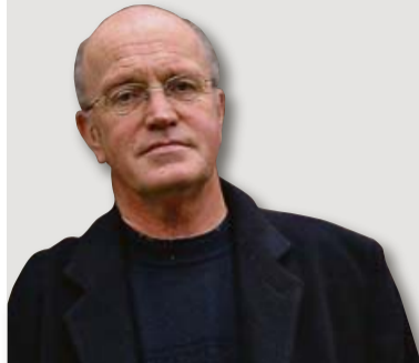
Iain Sinclair. IAIN SINCLAIR.ORG

► Enhorabuena a todos. Si el año pasado Alpha Decay oficiaba el bautizo en castellano del galés Iain Sinclair con esa antología que tituló La ciudad de las desapariciones , ahora da un paso más y, de su mano, lleva al lector a cruzar el Atlántico. Quienes se sumieron con Sinclair en su mordaz viaje crítico por las mutaciones de Londres en las cuatro últimas décadas adivinan bien que saltar con él a Estados Unidos es zambullirse en una fascinante prospección sin límites previsibles. Sinclair tiene allí a muchos de sus maestros espirituales —empieza rastreando la