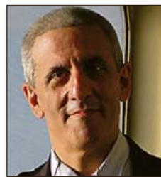
David Rieff.