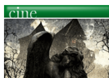
Estrenos de la semana

Hablamos con el comisario del proyecto Domino canibal en el PAC de Murcia | Intervención de Jimmie Durham en imágenes