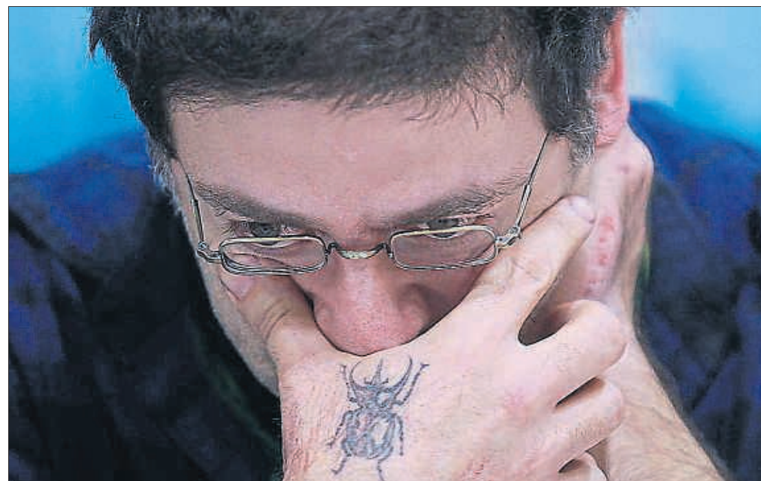
XAVIER GÓMEZ / ARCHIVO