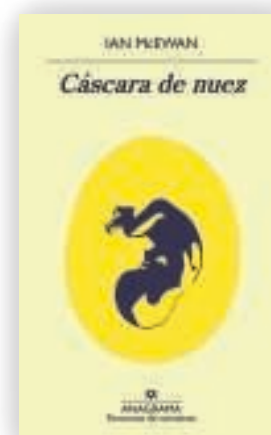
Ian McEwan Cáscara de nuez Anagrama

Máximo exponente del gótico sureño, Harry Crews regresa a la librería con «La maldición gitana», un nuevo relato de desamparo y tropiezo con el que el autor de «El cantante de góspel» vuelve a hacer diana en el corazón de las bajas pasiones humanas. Alimentando un poco más esa galería de seres abollados que tan bien perfiló antes de fallecer en 2012, Crews da voz aquí a un sordomudo de piernas minúsculas y brazos portentosos sobre el que pesa una curiosa maldición. Una condena que empezará a cobrar forma en cuanto entran en escena la joven Hester y dos boxeadores con pocas luces.