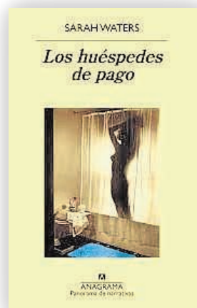
Sarah Waters Los huéspedes de pago Anagrama

En una nueva pirueta literaria digna de admiración, el autor británico Ian McEwan da voz a un narrador no-nato, un feto con las antenas bien orientadas hacia todo lo que ocurre a su alrededor, y se impone la titánica tarea de reinventar «Hamlet» desde el útero materno. Un ejercicio de riesgo que el autor de «Expiación» supera con nota moteando de humor negro y trama detectivesca la historia de un adulterio y transformando a ese feto de voz poderosa en testigo de excepción de la deriva del Reino Unido.