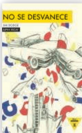
Jim Dodge No se desvanece Alpha Decay

Historia y escenario, fondo y forma, se funden a la perfección en «Los huéspedes de pago», novela con la que la autora galesa Sarah Waters abandona la época victoriana para adentrarse en esos felices años veinte que fueron cualquier cosa menos felices. Con los efectos de la guerra campando aún a sus anchas, «Los huéspedes de pago» cruza pasión y crimen a partir de la historia de una familia caída en desgracia que se ve obligada a abrir las puertas de su casa a inquilinos para poder hacer frente a las deudas.