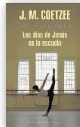
J. M. Coetzee Los días de Jesús en la escuela Lit. Randon House

Una década después de que El Aleph la recuperase bajo el título de «El Cadillac de Big Bopper», Alpha Decay publica de nuevo este clásico alucinógeno y alucinado con el que Jim Dodge imaginó un viaje de lo más descabellado: el que emprende el aprendiz de delincuente George Gustin para cumplir el deseo de una mujer y entregar simbólicamente un Cadillac al Big Bopper, fallecido junto a Buddy Holly y Ritchie Valens en un accidente aéreo. Una delirante huida con la que Dodge perfila una memorable galería de personajes y se da un atracón de redención, amor y culpa.