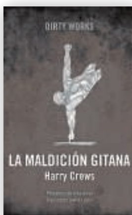
Harry Crews La maldición gitana Dirty Works

Después de darse a conocer con la colección de relatos «Knockemstiff» y la novela «El diablo a todas horas», Donald Ray Pollock echa el resto con esta epopeya en forma de western que cruza a Cormac McCarthy con Quentin Tarantino. Una perversa sátira sobre el progreso capitaneada por tres hermanos que cambian sus aparejos de granjero por holgados disfraces de forajido mientras recorren unos Estados Unidos alborotados por la Primera Guerra Mundial que intentan abrazar (sin demasiado éxito) las promesas de la modernidad.