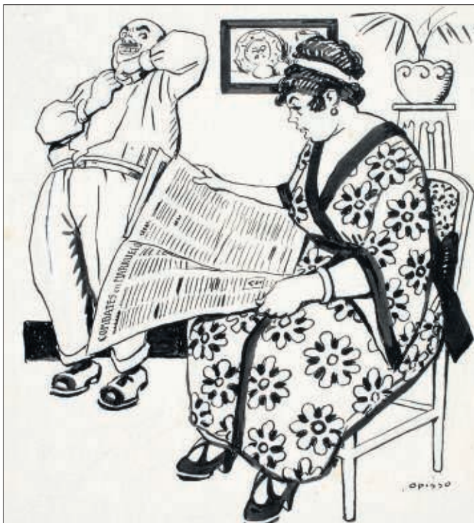
Dona llegint el diari, de Ricard Opisso.

en els supermercats (on l'anàlisi d'hàbits mostra qui és comprador indecís o fàcilment infidel a una marca s'hi ha descomptes), hi ha empreses que segmenten l'electo-