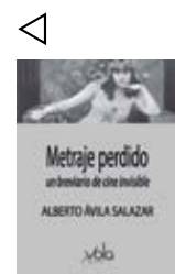
Archivos Vola, 2019, 101 págs. 9 €