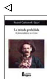
Fragua, 2019 240 págs. 23 €