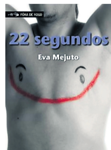
Los tres libros más prestados en castellano y gallego en la Biblioteca Ánxel Casal en 2020