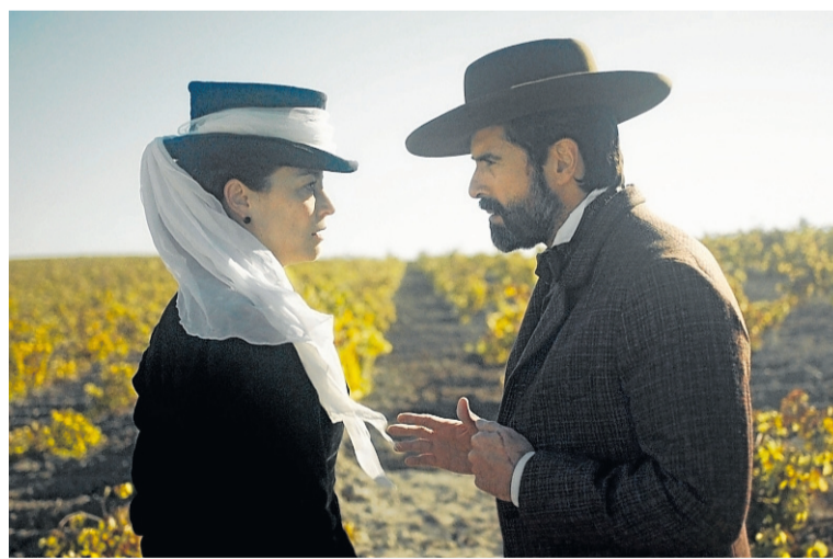
El pasado 26 de marzo Amazon Prime estrenó 'La templanza', la serie basada en el superventas de la escritora María Dueñas.