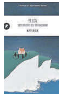
Ellos Kay Dick Automática Editorial 17 €