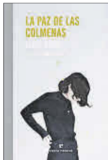
La paz de las colmenas Alice Rivaz Errata Naturae 18 €

«Crec que ja no estimo el meu marit». Amb aquesta frase comença el diari secret de Jeanne Bornand, protagonista d'aquesta nouvelle . Una obra pionera sobre la condició de la dona que va commocionar crítica i lectors quan es va publicar el 1947. Un al·legat lúcid, trencador i molt actual en el qual Alice Rivaz qüestiona la relació entre els gèneres i denuncia la dominació masculina sense dogmatismes.