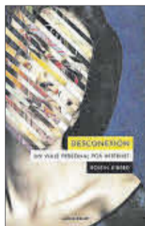
Desconexión Roisin Kiberd Alpha Decay 22,50 €