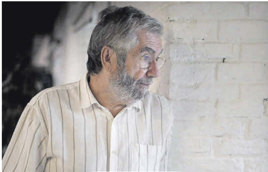
Antonio Muñoz Molina, Elisabet Benavent (abajo a la izquierda) y la última Nobel, Annie Ernaux.

'Bestsellers'. La autora viva que más libros ha vendido (hace poco superó la barrera de los mil millones), Danielle Steel, vuelve a las librerías con La aventura (Plaza y Janés). El rey del suspense y el horror, Stephen King, publica una no-