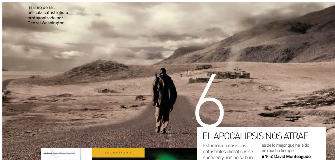
'El libro de Eli', película catastrófica protagonizada por Denzel Washington.