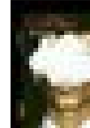
Género Negro leer fragmento [comprar]