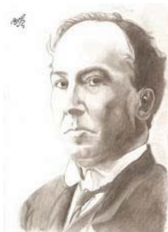
A. Machado, por Elena Sibaja (4º ESO). Febrero 2009