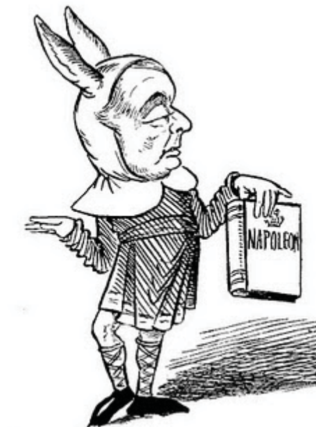
Uno de los dibujos de Gould