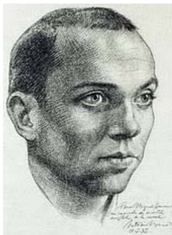
Miguel Hernández. Dibujo de Antonio Buero Vallejo