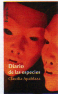
De arriba abajo, Diario de las especies (Barataria), Egosurfing (Destino) y La manera de recogerse el pelo (Bartleby).