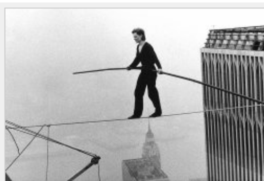
El funambulista francés camina sobre el abismo de las Torres Gemelas.

Aquel crimen entre las nubes -«un regalo a Nueva York de asombrosa e indudable belleza», según Paul Auster- se convertirá en un largometraje de ficción de manos de Robert Zemeckis. Philippe Petit tiene casi 60 años, vive al norte de Nueva York y se niega a hablar del 11-S porque en su corazón «las Torres siguen vivas». Continúa escuchando el viento a 400 metros de altura. Y no ha renunciado a cruzar el Cañón del Colorado.