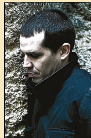
►►El cantante Espaldamaceta.