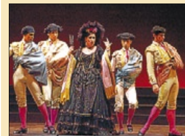
►►La cantante Rosa Ruiz.